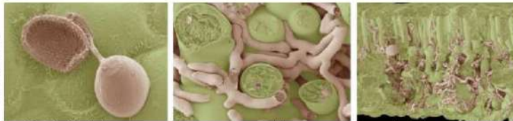
Germinación de la espora